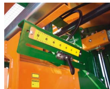
Die Holzlängenermittlung ist über den optischen Sensor stufenlos einstellbar.