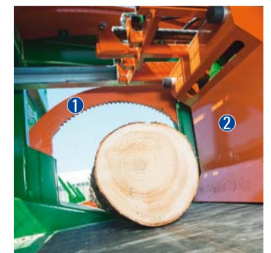
Niederhalter ① mit Holzschieber ② als Holzübergabe zum Spalter.