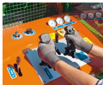
Die Bedienung des Spaltfix S-400 erfolgt über die Joystick-Zweihand-Steuerung.